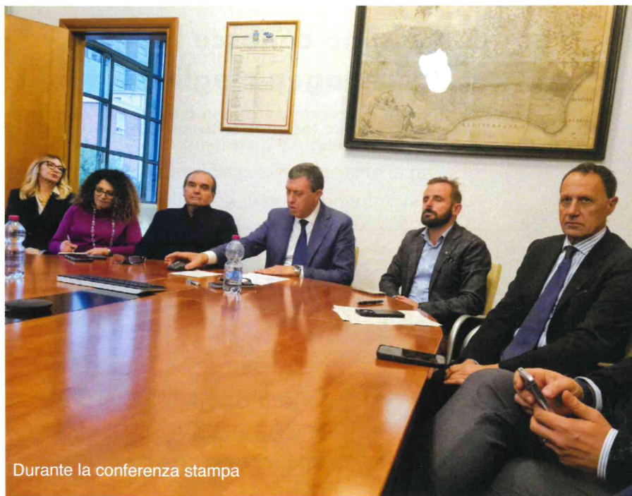
Durante la conferenza stampa

in maniera automatica per il passaggio dell'acqua nei canali che permetteranno un costante attingimento di acque per tutte le aziende agricole della zona.