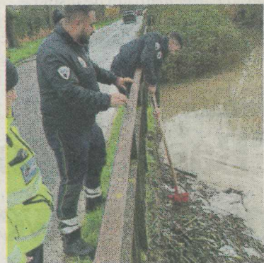
Alcuni volontari al lavoro

Tutti i giorni, per 24 ore, l'informazione in tempo reale.