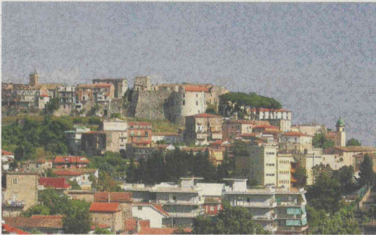
Una veduta del centro storico di Minturno

cia presso la stazione dei Carabinieri di Scauri. L'autore dell'iniziativa è M.E., un trentunenne che abita proprio in via Diritto Portico, il quale ha messo nero su bianco, formalizzando una denuncia contro ignoti. La sua auto, una Freelander, secondo quanto denunciato, era stata parcheggiata in via Diritto Portico, all'altezza del civico otto. La mattina seguente lo stesso proprietario ha notato che, durante la notte, sconosciuti avrebbe danneggiato il mezzo con diversi graffi al lato anteriore e posteriore destro, lato passeggero". M.E. ha anche segnalato che in zona c'è una teleca-